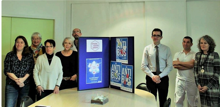
La prise de médicaments et ses dangers

Dans le cadre de la semaine nationale de la sécurité des patients, le Centre Hospitalier de Condom organise différentes actions pour sensibiliser la population sur la prise de médicaments et sur les dangers que cela peut entraîner.