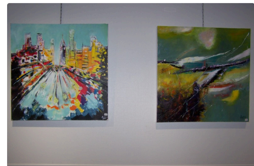
La grande avenue et Composition abstraite