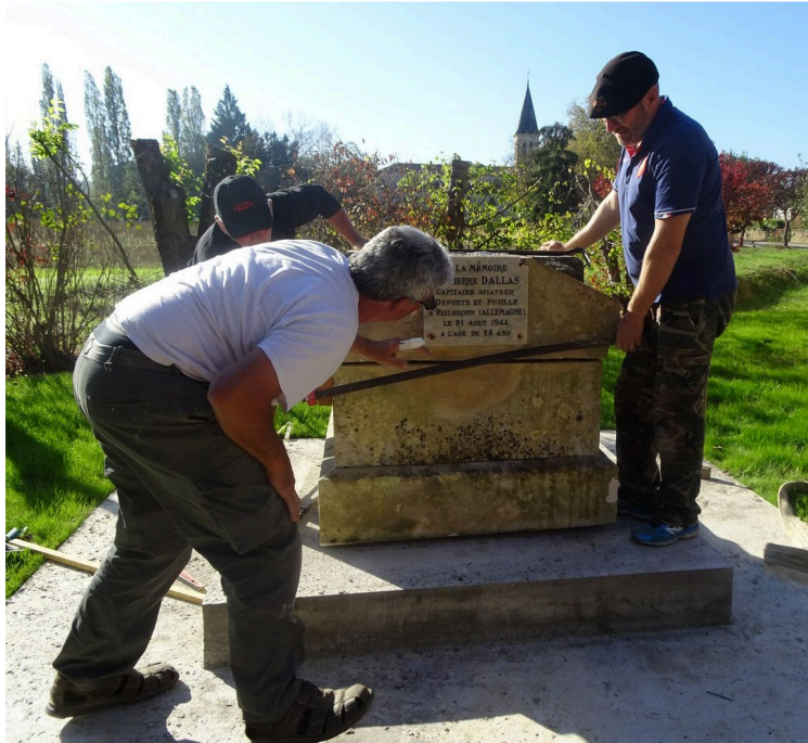
Une commémoration exceptionnelle après le déplacement du monument aux morts

En ce 11 novembre, le village de Moncorneil-Grazan va vivre une commémoration exceptionnelle. Outre la solennité particulière de ce 100ème anniversaire de l'Armistice, ce sera l'occasion d'inaugurer non pas un nouveau monument aux morts mais sa réfection totale et surtout son déplacement sur une petite placette située entre la mairie et la salle des fêtes.