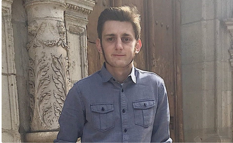
Cérémonie et événements pour le centenaire de la fin de la première guerre mondiale