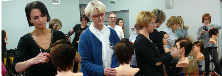
Coiffure : Passer de l'ultra féminin au super-rock ...

Les artisans coiffeurs du Gers ont travaillé sur la collection « Tentation »