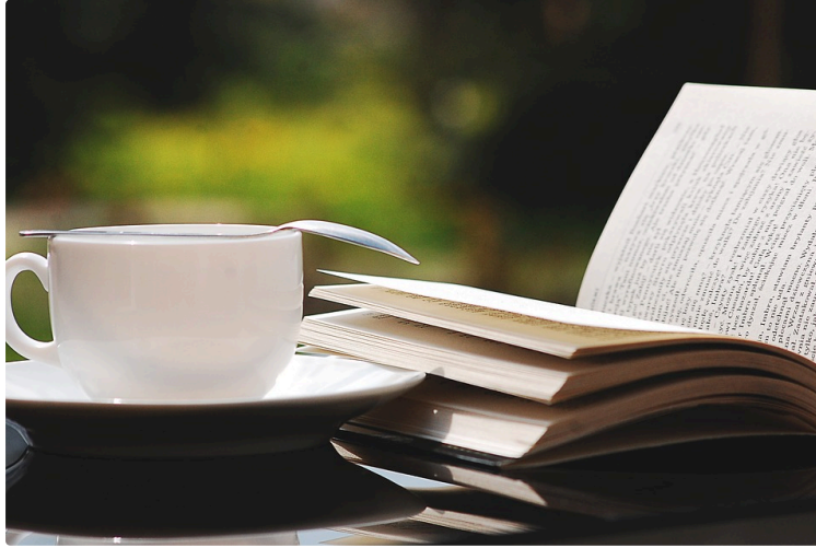
A vos marque-pages !

Chaque premier samedi du mois, le Journal du Gers vous propose une balade chez les libraires et vous révèle leurs coups de cœur du moment.