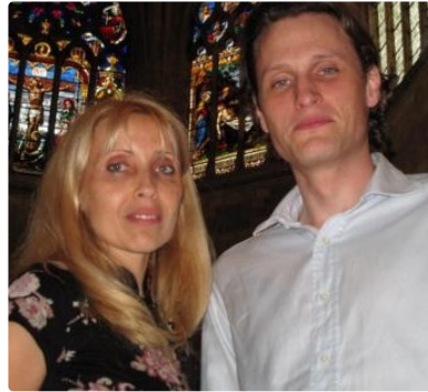
Concert : Orgue et voix du moyen âge au XIX siècle