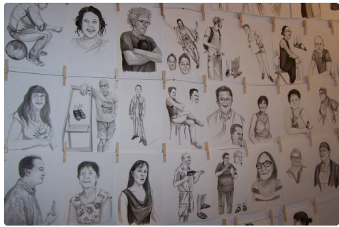
LES GENS DE LOMAGNE