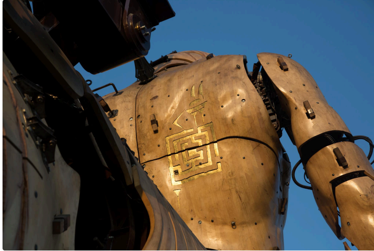
« Le Gardien du Temple » en exclusivité à Toulouse

Un Minotaure de quarante-sept tonnes va déambuler dans le centre-ville