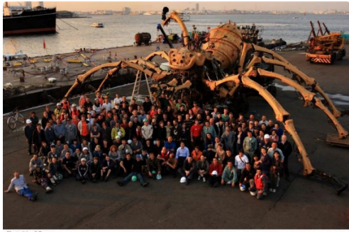
Port de Yokohama, avril 2009.