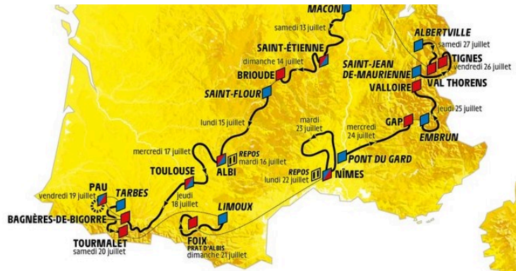
Tour de France 2019 : cap à l'Est

C'est de Bruxelles que partira le Tour de France, le 6 juillet 2019. Une façon de rendre hommage à Eddy Merckx, symbole par excellence du Maillot Jaune, qui remporta la première de ses cinq victoires en juillet 1969.