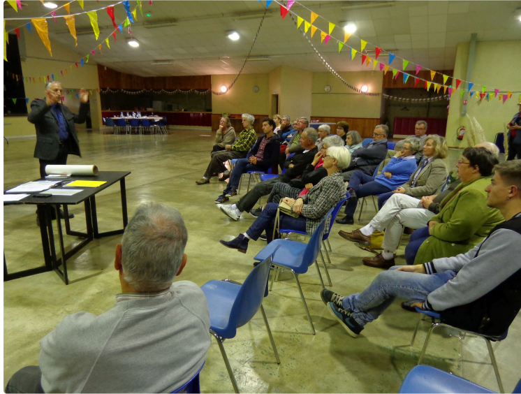
Orgue Culture et Musique en Val d'Adour

Passionnantes, les rencontres proposées à 18h, tous les jours de cette folle semaine sont très agréables et instructives pour les participants.