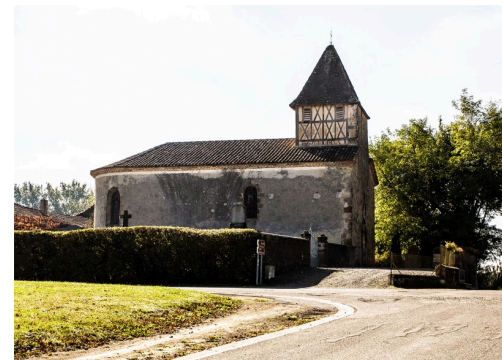
Eglise de Saint-Martin-d'Armagnac