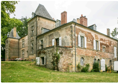
Château de Saint-Martin-d'Armagnac