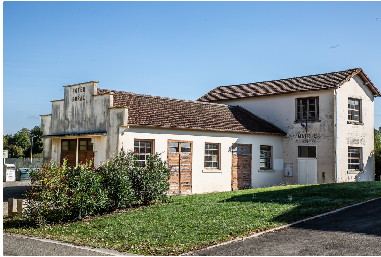
Budget participatif : réaménager le foyer de Saint-Martin-d'Armagnac

Pour y pratiquer le théâtre, le basket, la zumba etc.