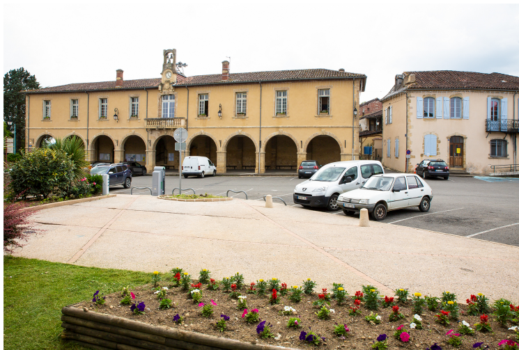
Budget participatif : les projets d'Aignan

Aménager l'école de musique, coudre des uniformes pour l'espace Fontan et peindre une fresque au boulodrome