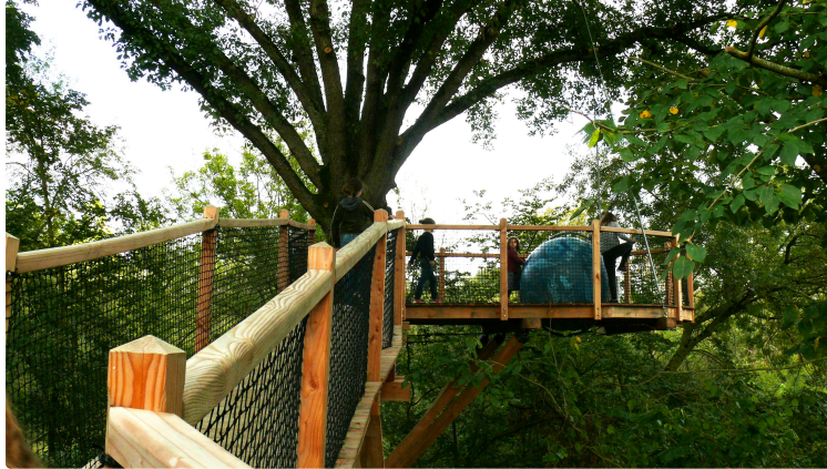
L'oeuvre "Suite de Pan" un hommage à la biodiversité