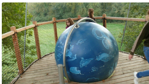
La sphère de la biodiversité.