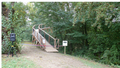
La rampe d'accès à l'oeuvre.