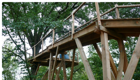
Une oeuvre monumentale.