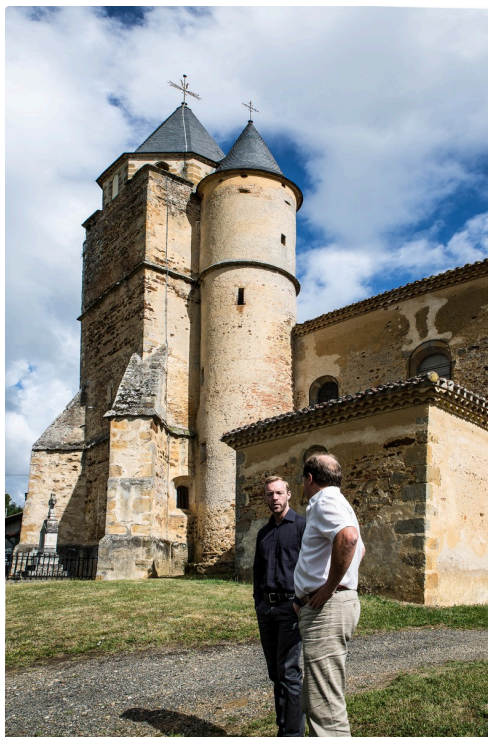
L'église et sa tour