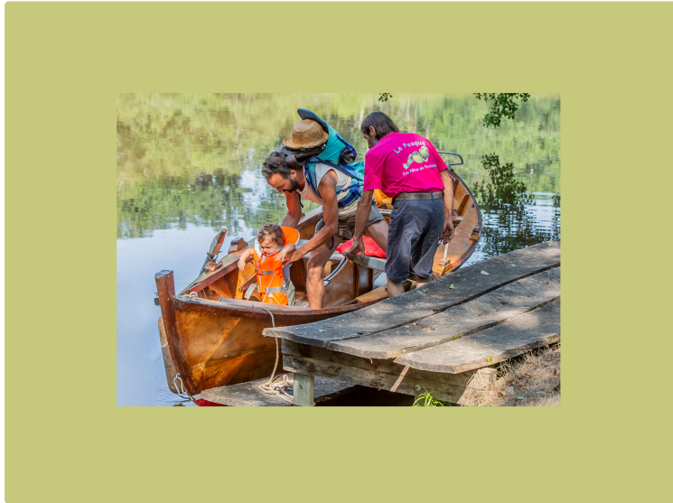
Voter pour un espace culturel et historique à Perchède

À créer avec le Budget participatif gersois