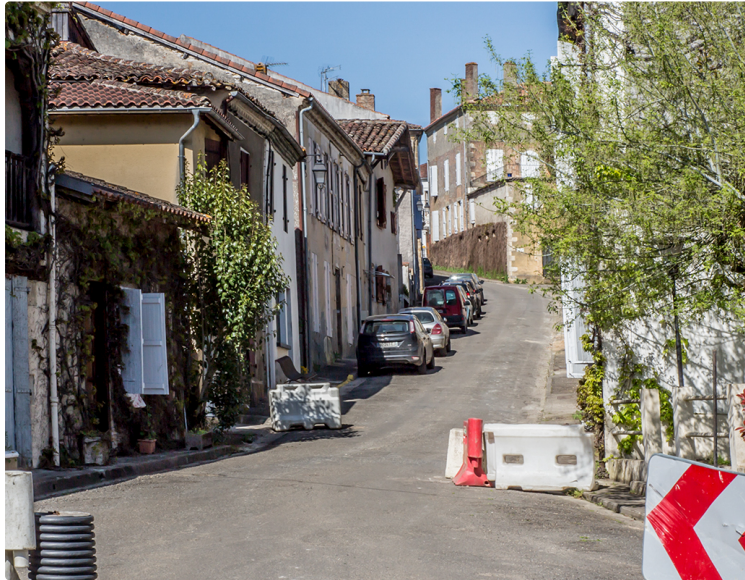
Voter pour embellir le rempart de Manciet

On sait que la route qui traverse le village a été rénovée récemment. Cela fait ressortir la grisaille du « rempart » qui borde cette route sur 200 m. Le projet n°153 a donc pour objet de recouvrir ce rempart d'une fresque exécutée par un artiste peintre.