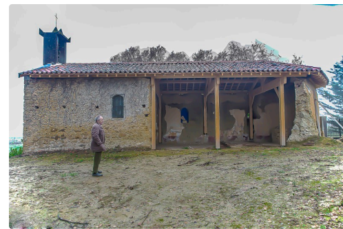
La chapelle de Daunian en cours de rénovation ; au 1er plan, le maire, Jean Duclavé