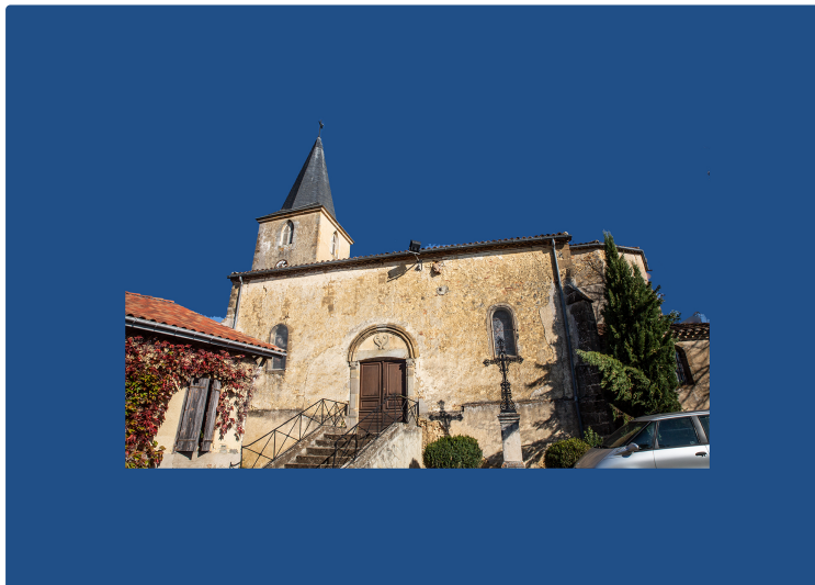
Budget participatif : les projets de Magnan