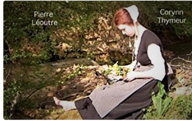
Le surnaturel dans l'histoire au festival Bizarre