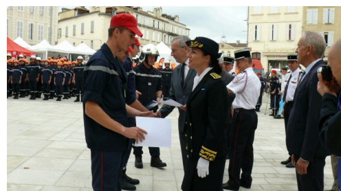
Remise de diplôme.