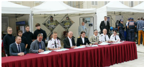
Signature de la convention entre le Foyer Louise Marillac, la préfecture et les services de sécurité.