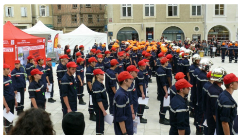
Les Jeunes sapeurs pompiers volontaires étaient au nombre de 125.