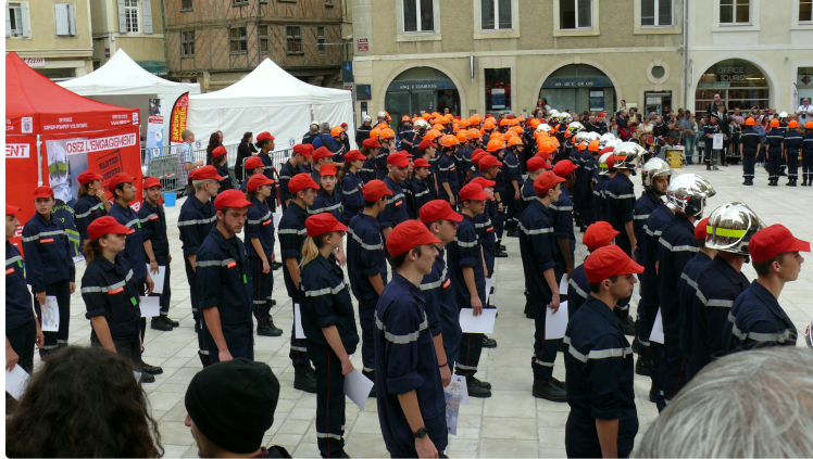
Les forces de sécurité publique intérieure ont créé l'événement sur le parvis de la cathédrale

Les rencontres de la sécurité intérieure sont un rendez-vous important pour les forces de sécurité publique, gendarmerie, police, pompiers, armée ... elles permettent de rapprocher les Français curieux de savoir comment leur sécurité est assurée. Pour cela la préfecture du Gers n'a pas hésité ce samedi 13 octobre en matinée de délocaliser l'événement sur le parvis de la cathédrale afin d'en faire profiter un public venu nombreux.