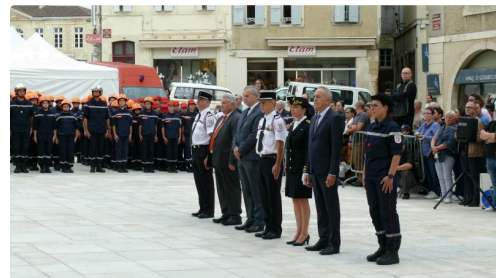
Les autorités civiles et militaires.

A l'issue de la cérémonie le public a pu découvrir et s'informer auprès des stands de la Croix Rouge, de la Croix Blanche, de la gendarmerie nationale, de la police municipale, de l'armée, de la préfecture et des sapeurs pompiers.