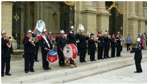
La partie musicale a été assurée par la musique des sapeurs pompiers du Gers.