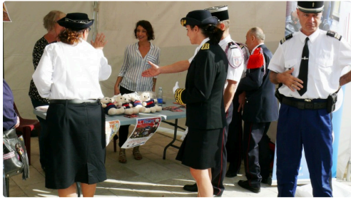
Le stand de la peluche Pompy.