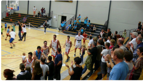
Les joueurs sont allés à la rencontre du public.