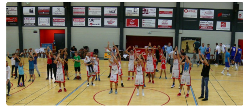
Le traditionnel clapping après la victoire.