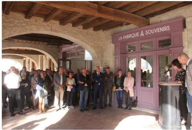
Le Bureau d'Informations Touristiques dédié à l'oenotourisme inauguré

Mercredi 10 octobre, le Bureau d'Informations Touristiques de Montréal du Gers, dédié à l'oenotourisme, labellisé Vignobles et Découvertes a été inauguré en présence de nombreuses personnalités.