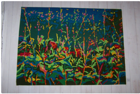
De superbes couleurs..