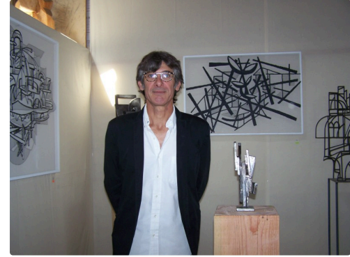
Devant ses oeuvres