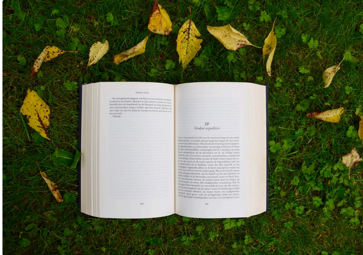
A vos marque-pages !

Chaque premier samedi du mois, le Journal du Gers vous propose une balade chez les libraires et vous révèle leurs coups de cœur du moment.