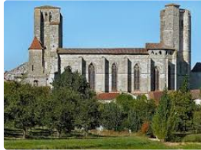
Archéologie, Architecture,et musique.