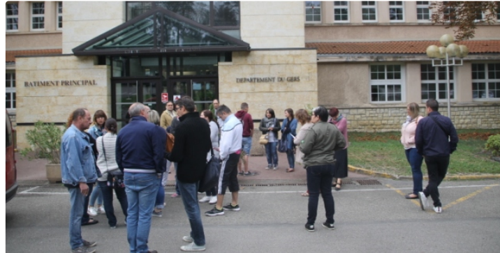
Les grévistes du CHS à la rencontre des élus départementaux

Lundi 1er octobre, devant la tente installée à l'entrée du CHS d'Auch, les grévistes se sont réunis pour un départ en manif vers le conseil départemental à la rencontre des élus départementaux pour qu'ils assument leurs responsabilités de collectivité territoriale de référence.