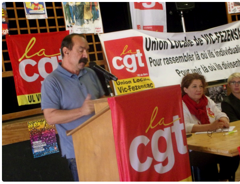
Intervention de Philippe Martinez en fin de meeting