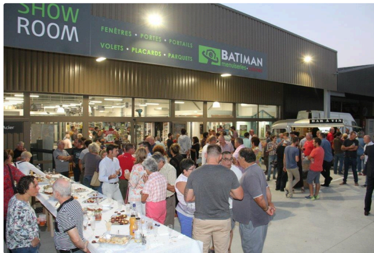
Sommabere une entreprise du pays

L'entreprise familiale fidèle à ses racines