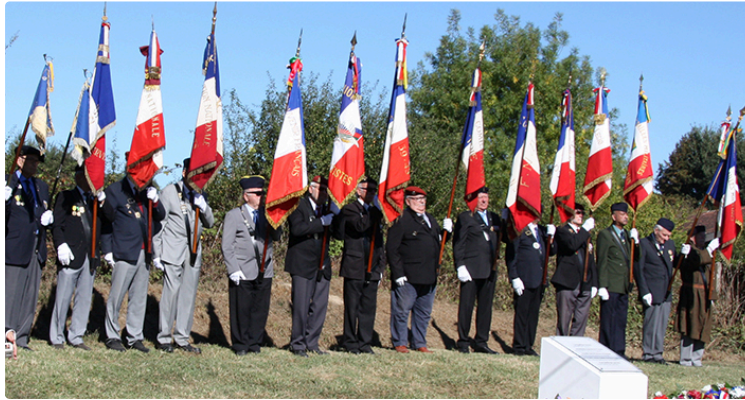
Commémoration de la journée des Harkis

25 septembre une date bien ancrée dans le calendrier officiel