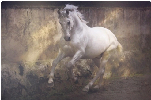
Grandeur de la vie