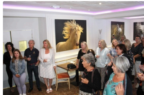
Le public sous le charme