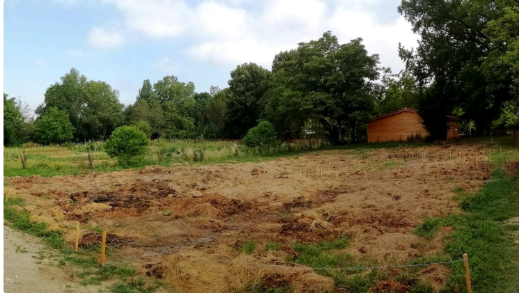
AUCH leur joyeux jardin