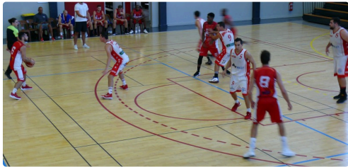
Phase de jeu.