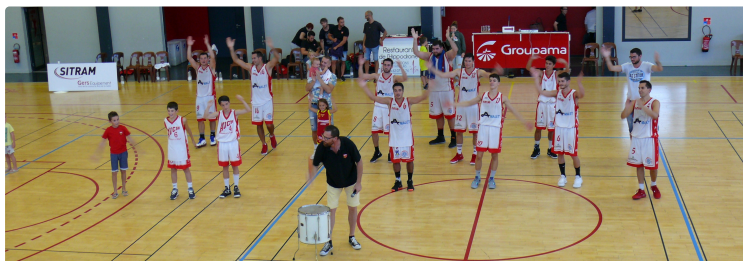
Championnat de France Basket NM3 : Auch seul leader

Les Auscitains s'imposent face au stade Clermontois au cours d'une seconde mi-temps aboutie