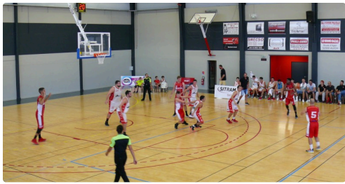
La défense auscitaine verrouille la raquette.