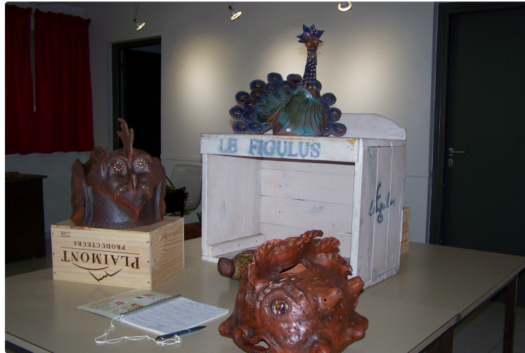
Exposition à l'Office de tourisme de la Gascogne Toulousaine : Les potiers Nicolas et Hervé Guegan exposent leurs étonnantes pièces...