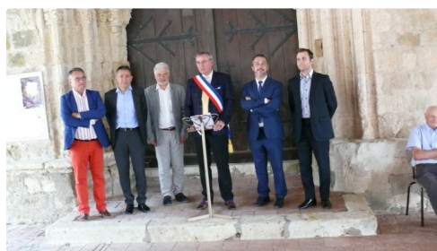
Les discours ont eu lieu sous la halle.