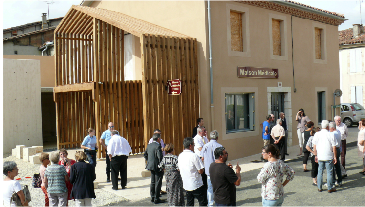
Extraordinaire réactivité de la municipalité pour conserver deux médecins, deux infirmières et la pharmacie

En créant un cabinet médical, Puycasquier fais fi de la désertification médicale en milieu rural