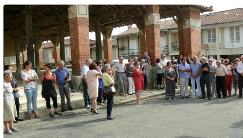
Beaucoup de Puycasquiérois ont assisté à l'inauguration. https://lejournaldugers.fr/article/29865-extraordinaire-reactivite-de-la-municipalite-pour-conserver-deux-medecins-deux-infirmieres-et-la-pharmacie