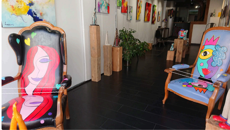
Save The Arts Gallery / présentation le 22 septembre

Le 22 septembre Save The Arts organise un événement culturel. Save The Arts souhaite faire diffuser son événement culturel. Les photos qui suivent illustrent et définissent le style et l'humeur artistique de cet exposition .