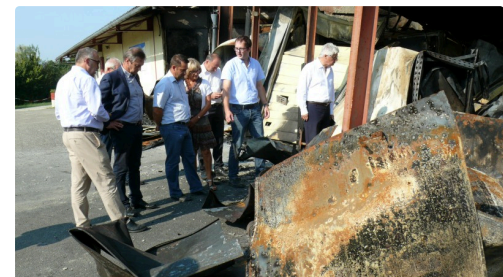
Découverte au plus près des dégâts.