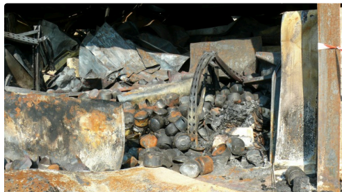
Les conserves calcinées.