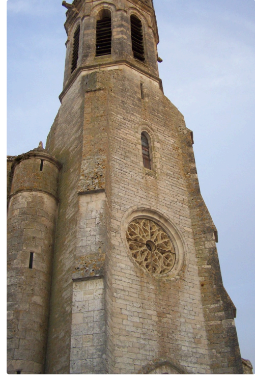
Un des côtés de l'église