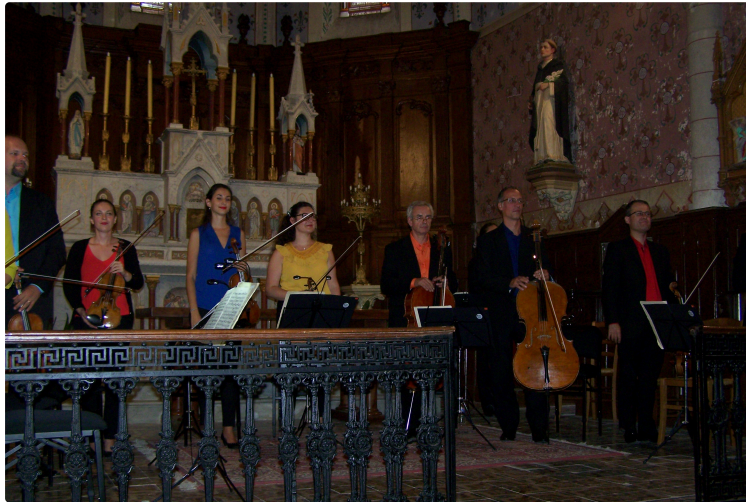
A l'Eglise Saint-Vincent de Sarrant : brillante interprétation par l'Orchestre de Chambre de Toulouse pour les Journées du Patrimoine

Le groupe des musiciens est venu afin de soutenir le patrimoine architectural, un geste magnifique car les bénéfices iront au profit de la sauvegarde de l'église de Sarrant..Il faisait bon ce samedi en fin de journée, de nombreux mélomanes remplissaient l'espace religieux de la belle église, construite sur plusieurs siècles ( de XIIIè au XIXè siècle) restera inachevée car l'actuel chevet médiéval devait être remplacé par un chevet plus grand ( plus large et plus haut) prolongeant la nef « Renaissance »..