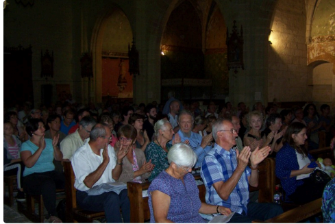
Un bel auditoire