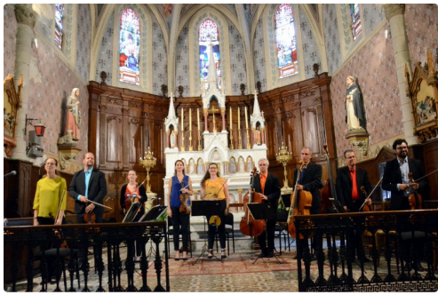
Sarrant 0457 (1).JPG