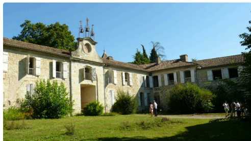
Vue des bâtiments.