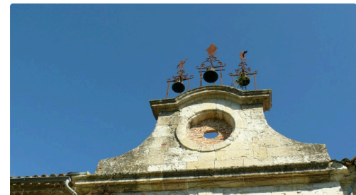
L'horloge était surmontée de trois petites cloches sur un support de ferronnerie, ornées de silhouettes en métal découpé représentant la Vierge entourée de deux anges sonnant de la trompe.