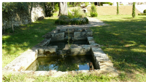
Bacs pour le lessivage des peaux.