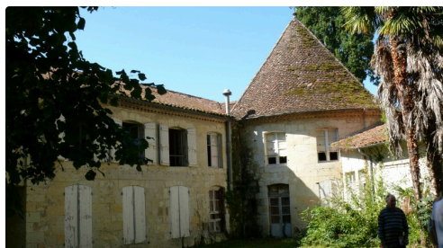
Vue des bâtiments.