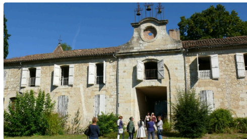
Vue des bâtiments.