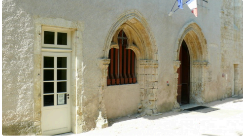
Entrée de la maison de la culture.