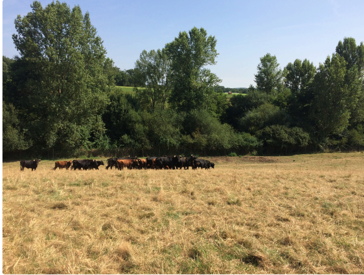
Toros y Vinos