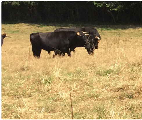
2 novillos qui seront lidiés dimanche