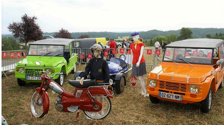
Les Chevrons Lasséranais fêtent 2CV et Méhari

Le club « Les Chevrons Lasséranais » organisait dimanche 9 septembre une concentration de véhicules pour fêter les 70 ans de la 2CV et les 50 ans de la Méhari.