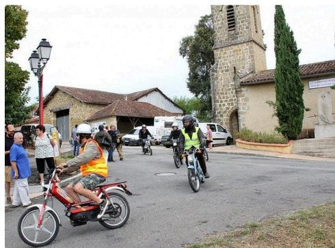
A fond les mobylettes !