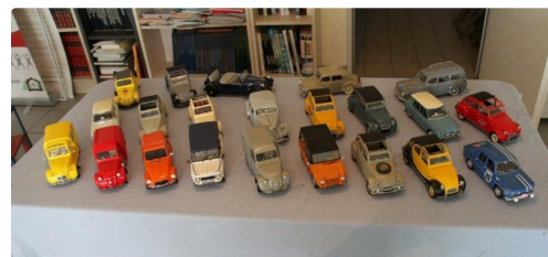
Plus facile de choisir...