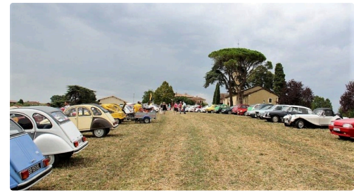
Un parking au parfum rétro