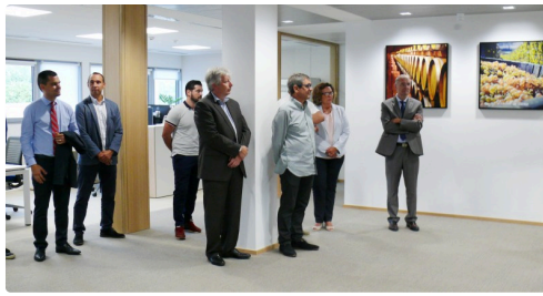
Les personnalités lors des discours.