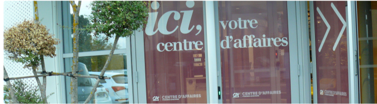
Une première pour le Crédit Agricole Pyrénées Gascogne

La banque mutualiste vient d'inaugurer son premier Centre d'Affaires