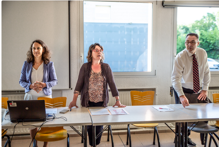
Richesse des formations interconnectées au lycée de Nogaro

La nouvelle proviseure à la tête d'une direction féminine