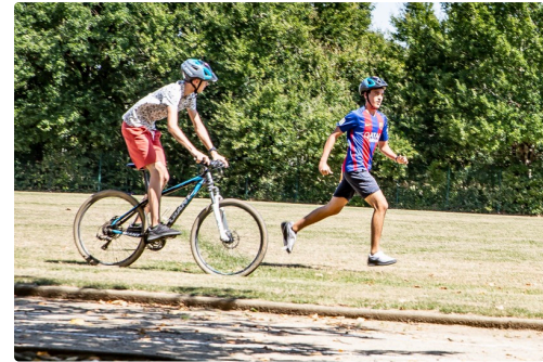
Course à 2 (à VTT et à pied avec