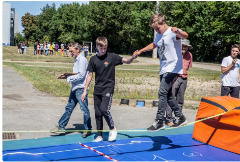
Jouer les funambules