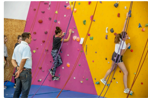
Passage au mur d'escalade