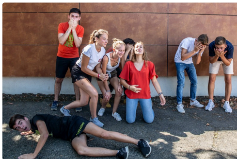
Création d'un tableau vivant