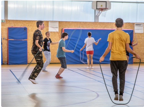
Saut à la corde