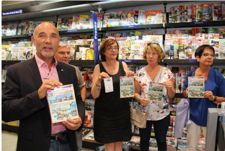
Le loto du patrimoine débarque à Condom

Ce matin à Condom, comme dans tous les points de vente de la Française des Jeux les billets du Loto du Patrimoine étaient en vente comme ceux du jeu à gratter "Mission Patrimoine". Six points de vente pour la sous préfecture intéressée au premier chef par cette opération imaginée et menée par Stéphane Bern. Ici le lancement de la campagne était particulièrement attendu, car Condom avec l'hôtel de Polygnac fait partie des 18 sites privilégiés parmi les 256 admis à participer à cette campagne lancée par l'animateur de télévision pour venir au secours des patrimoines vernaculaire des villages de France.