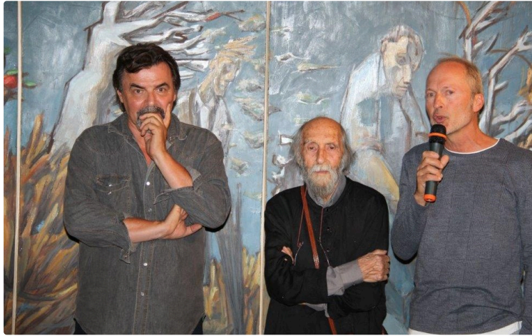
"Manière d'être" à l'espace Saint-Michel

Introduisant l'intitulé de l'exposition « Manière d'être », présentée en l'espace Saint-Michel de Condom, deux peintres mis en scène par l'arthothèque de Gondrin nous proposent leur vision du Tragique.