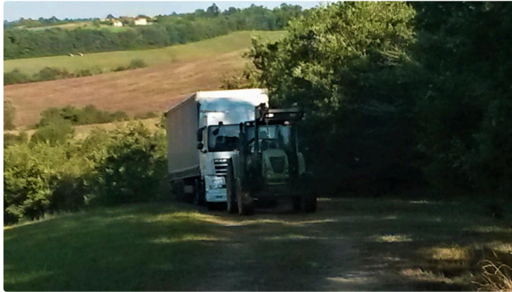
Non, Saint-Pierre n'est pas Saint-Mont !

C'est un phénomène récurrent depuis plus d'un an pour ces résidents d'un petit chemin de la commune de Saint-Pierre d'Aubézies.