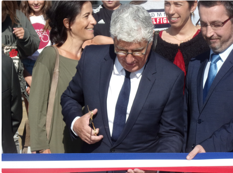
inauguration du 22ème collège du Gers