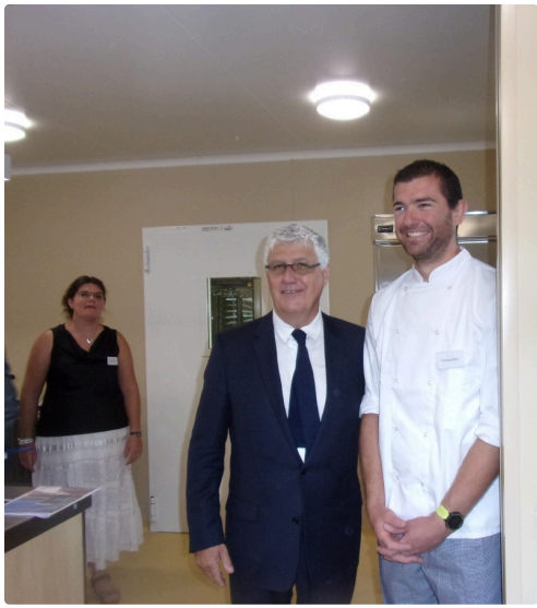
Visite des cuisines, présentation du chef