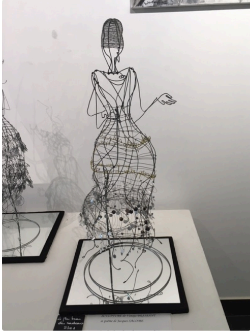
"Les femmes fil de fer" de Vanaja Braibant