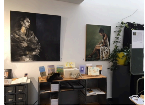
Le coin des auteurs