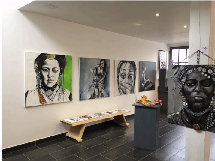
Une exposition multiculturelle à quelques pas du Gers

Photo : Les oeuvres de Frédérique Nadia Gros