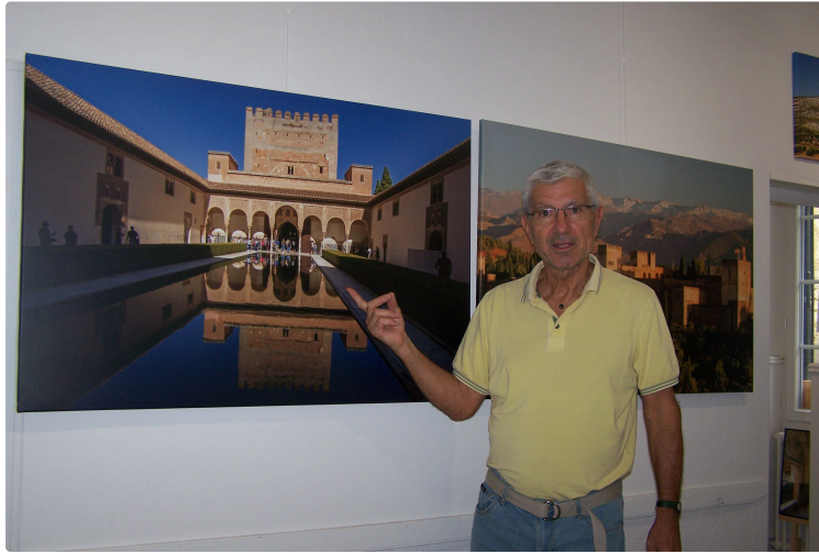
Magnifiques vues sur l'Alhambra photographiées par Gilles Nicoud

Photo : Gilles Nicoud devant une de ses photos