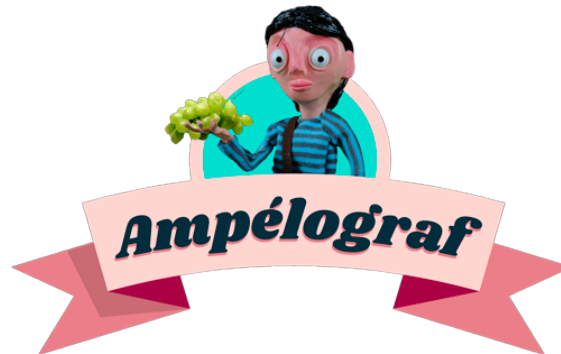
L'appli Ampélograf fait voyager les familles de la vigne au chai, sur iOS et Android