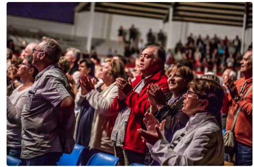
Le public est sans cesse debout