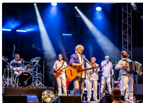
L'artiste au milieu des musiciens