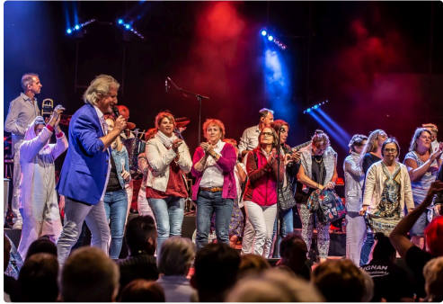
Des femmes du public invitées sur scène