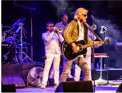
Patrick Sébastien imite Johny Halliday