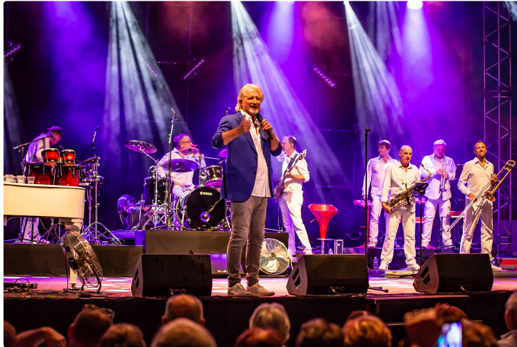
Patrick Sébastien : « C'est grossier, c'est vulgaire mais c'est vivant ! »

Plus de 650 fans sont venus applaudir Patrick Sébastien, ses girls et ses musiciens samedi 25 août 2018 aux arènes d'Aignan. On peut dire que, pour Aignan, c'est un immense succès.